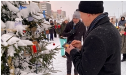
Toisena adventtina lunta oli ruhtinaallisesti ja pakkastakin oikein sopivasti.