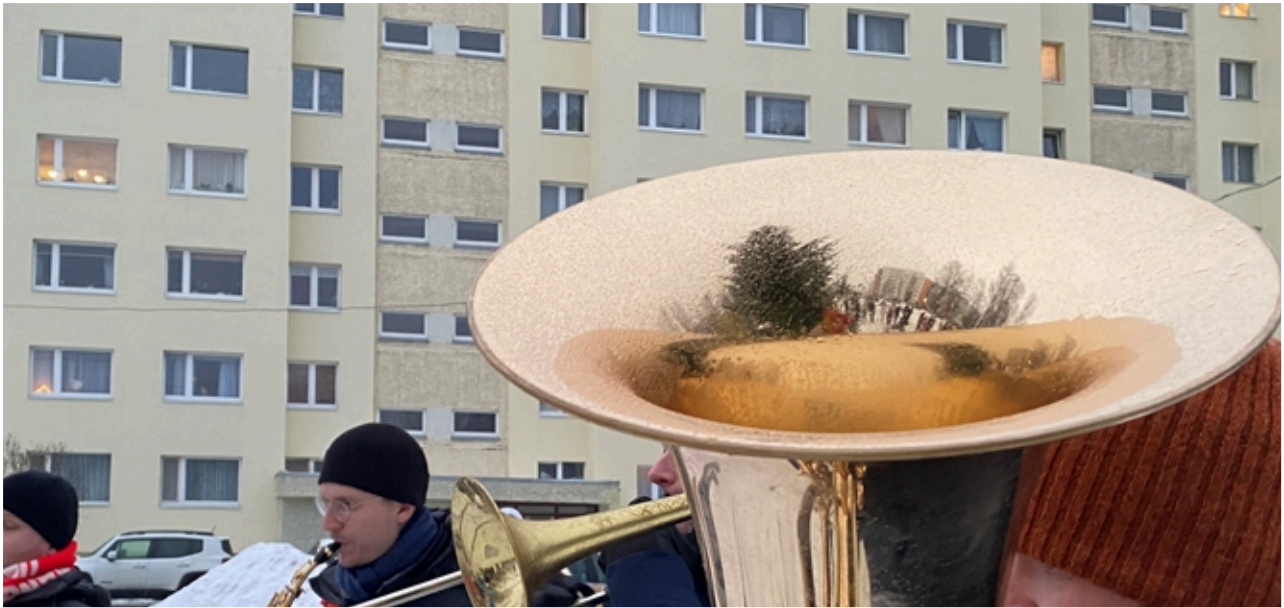
Joy to the World, the Lord is come! Hõiska maailm, pea tulemas on Issand sinule! Riemuitse maa, kun Kuningas jo saapuu kansojen!