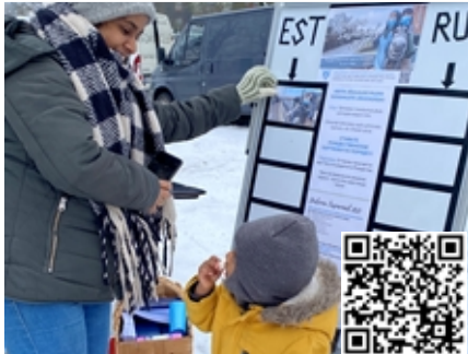
Kun järjesti jouluevankeliumin kuvat tapahtumajärjestykseen, sai palkinnoksi sukat/lapaset tai kuvaraamatun.