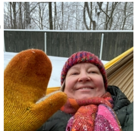
Vielä kerran vilkutus riippukeinusta pihapuiden välillä. Ensi kerralla täytyy viritellä keinu metsään.