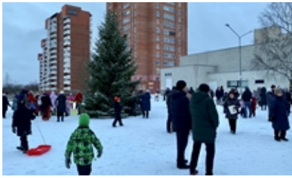
Ensimmäinen adventtikynttilä syttyi Lindakiven aukiolla. Ensilumi oli juuri satanut.