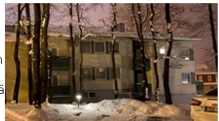
Uusi tupani on tuolla yläkerran keskimmäisten ikkunoiden takana.